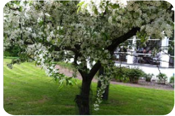
Dr. Canda'nın fotoğrafladığı güzel bir parka ait görünüm. Dr. Canda captured this image of a beautiful park.